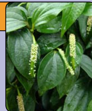
Poivre noir ( Piper nigrum )